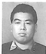
本部局員書記局担当