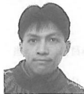
本部局員会計局担当