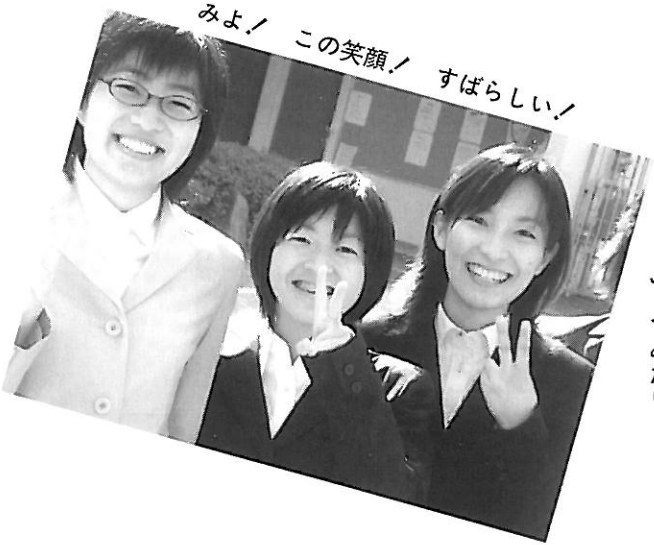
たまには真面目ぶってみたり。